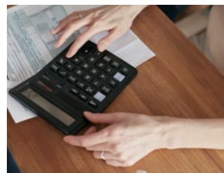
7 Tips inzake de btw