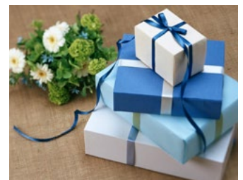
4 Tips voor werkgevers