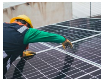
3 Tips voor de bv en de dga