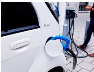
5 Tips voor de automobilist