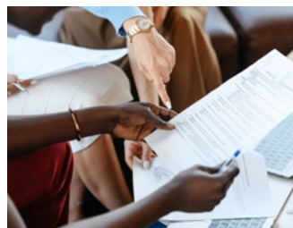
2 Tips voor de ondernemer in de inkomstenbelasting