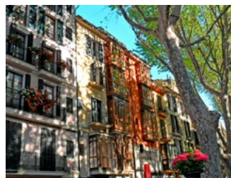
6 Tips voor de woningeigenaar