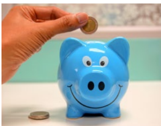
1 Tips voor alle belastingplichtigen

In de Special Eindejaarstips hebben wij zo veel mogelijk rekening gehouden met de plannen van het kabinet voor volgend jaar. Daarnaast hebben we ook enkele tips rondom coronamaatregelen opgenomen.