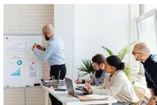
10 Overige corona-actualiteiten voor werkgevers