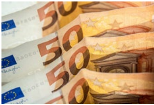
1 Varia loon- en premieheffing

Tevens bevat deze editie informatie over bijvoorbeeld de auto van de zaak, de thuiswerkvergoeding, de WKR en de transitievergoeding. De hoofdstukken 7 tot en met 10 in deze special gaan in op diverse coronagerelateerde maatregelen.