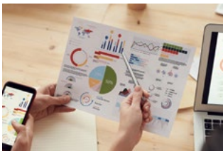
5 Wet DBA