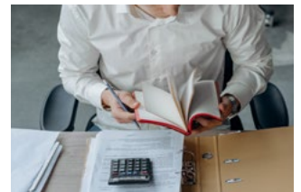
8 Tijdelijke Noodmaatregel Overbrugging Werkgelegenheid