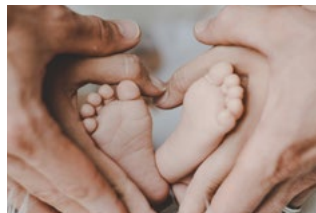
6 Varia Arbeidsrecht en sociaal zekerheidsrecht