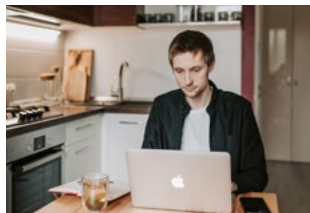
7 Corona en thuiswerken