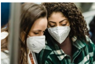
9 Corona en bijzonderheden werknemer