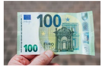
4 Wet tegemoetkomingen loondomein