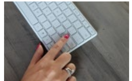
3 Ondernemingen en ondernemers