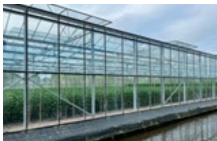
8 Verduurzaming en klimaat