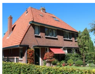
6 Tips voor de woningeigenaar