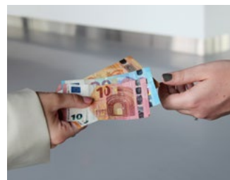
3 Tips voor de bv en de dga