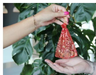
7 Tips inzake de btw