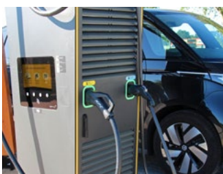
5 Tips voor de automobilist