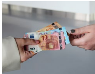
2 Gebruikelijk loon en vrijwilligersvergoeding